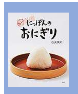
『にっぽんのおにぎり』 白央篤司（理論社）