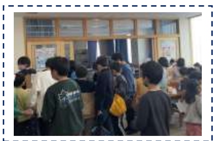
ダンボールガチャは、大人気です！

《ウィンちゃんとフラップくんのダンボールガチャ企画》ただいま実施中！ カプセルの中に番号が書いてあります。その番号のカードを図書委員からもらいます。 カードに書かれたタイトルやテーマの本を探しに、図書館の中を探検します。 本を見つけられたら、きっといいことがありますよ。休み時間に挑戦してくださいね。