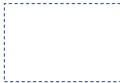
ガチャを作ってくださったBOOKメイトさんたち

2月20日(火)・27日(火)の業間休み 図書委員のミニコンサートを開催します！ 『えのぐちゃん』というおはなしの紙しばい うた、演奏、ペープサートを練習しています。 是非、見に来てください！